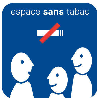
Espace sans tabac

Deux visuels génériques complémentaires, adaptés à tous les lieux et situations :